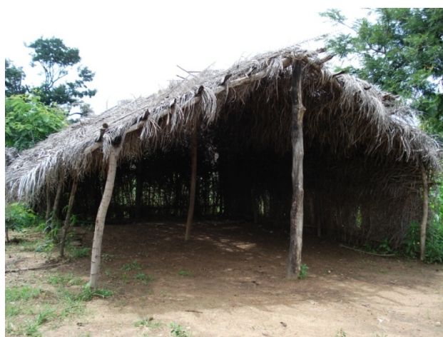
Paillote servant de salle de classe à l'EDIL BELLE VILLE à Kara

Notre projet prévoit également la formation d'un comité de parents d'élèves plus fonctionnel, afin de contribuer plus efficacement à la résolution des problèmes en milieu scolaire.