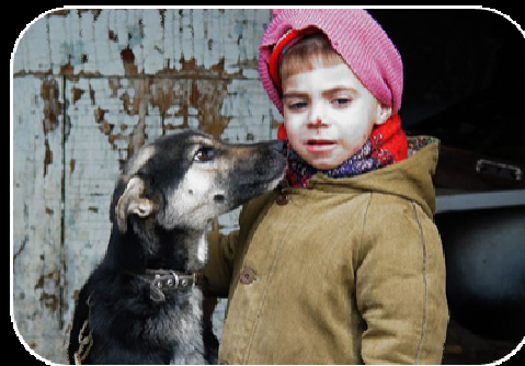
Пренебрежение интересами и нуждами ребенка